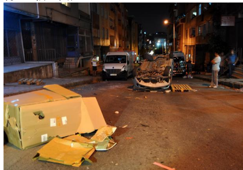
（HD 紙インターネット版より）

政府の発表によれば、現在トルコ国内に居住するシリア難民の数は約 120 万人（難民キャンプ内居住者 28 万 5000 人、一般地域居住者 91 万 2000 人）とされている。（8 月 26 日付 HD 紙 2 面）